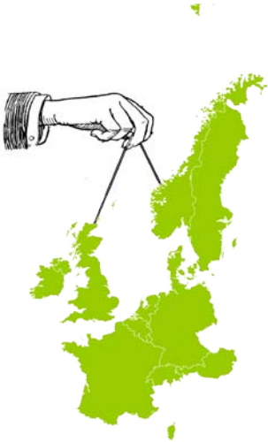
Schéma 1: Transactions foncières mondiales

227 millions d'hectares ont fait l'objet d'acquisitions depuis 2001, soit l'équivalent de la taille de l'Europe du Nord-Ouest.