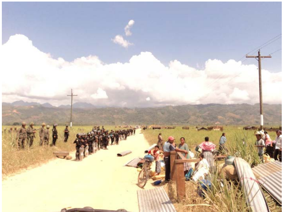
Miralvalle, vallée du Polochic, Guatemala, 15 mars 2011. La communauté a été expulsée, les maisons et les cultures détruites

La nouvelle vague de transactions foncières ne correspond pas aux nouveaux investissements agricoles que des millions de personnes attendaient. Les plus démunis sont les plus durement touchés par l'intensification de la concurrence pour les terres. Il ressort des études d'Oxfam que les habitants sont invariablement perdants face aux élites locales et aux investisseurs nationaux ou étrangers, faute de disposer du pouvoir nécessaire pour faire valoir leurs droits de façon efficace ou pour défendre et promouvoir leurs intérêts. Les entreprises et les gouvernements doivent de toute urgence adopter des mesures visant à améliorer les droits fonciers des personnes qui vivent en situation de pauvreté. Les relations de pouvoir entre investisseurs et communautés locales doivent aussi évoluer si l'on veut que les investissements contribuent à la sécurité alimentaire et aux moyens de subsistance des communautés locales au lieu de leur porter préjudice.