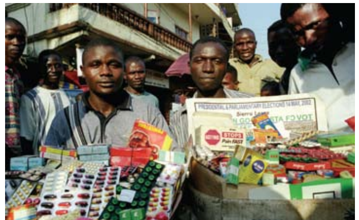
A Freetown, Sierra Leone, des marchands vendent au marché divers médicaments soumis ou non à prescription médicale. Nombreux sont sortis de leur boîte d'origine ou sont périmés.

Dans le même temps, la recherche internationale réaffirme au travers d'une littérature de plus en plus abondante que, malgré les problèmes très sérieux rencontrés dans de nombreux pays, les services financés et fournis par l'Etat continuent de représenter le système de santé le plus performant et le plus équitable. Aucun pays d'Asie à faibles ou moyens revenus n'est parvenu à proposer un accès universel ou quasi universel aux soins de santé sans compter uniquement, ou principalement, sur une offre de services publics financée par les impôts. L'augmentation de l'offre publique a entraîné d'énormes progrès en dépit de la faiblesse des revenus. Une femme du Sri Lanka, par exemple, peut s'attendre aujourd'hui à vivre aussi longtemps qu'une femme allemande, malgré un revenu dix fois inférieur. Si elle enfante, elle a 96 pour cent de chances d'être assistée par du personnel de santé qualifié.